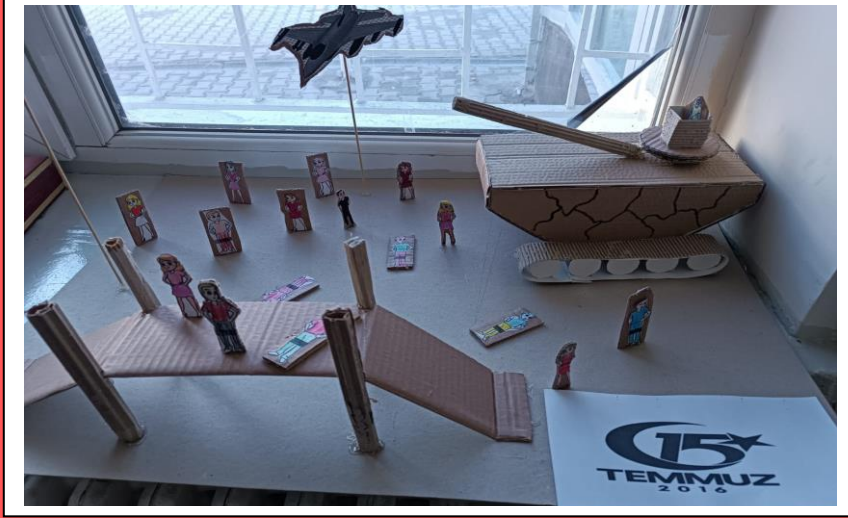
15 TEMMUZ MODELİ