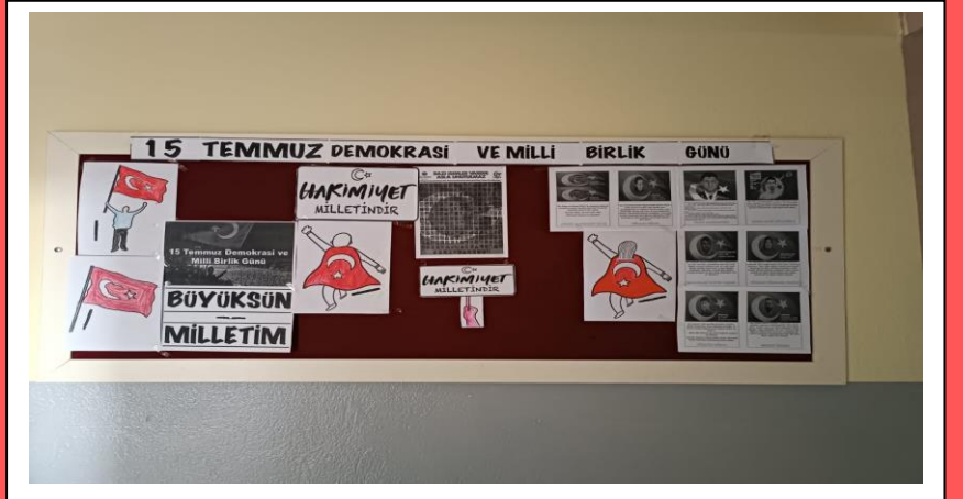
15 TEMMUZ PROGRAMI